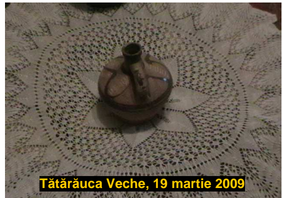
Tătărauca Veche, 19 martie 2009

www.hilfswerk-austria.md/euvotez/power_point-176.html