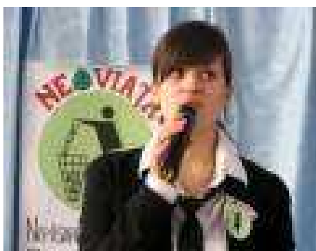
14 martie 2009. Rezina, exercitiul de simulare a alegerilor

http://www.youtube.com/watch?v=4CQdVNupX24